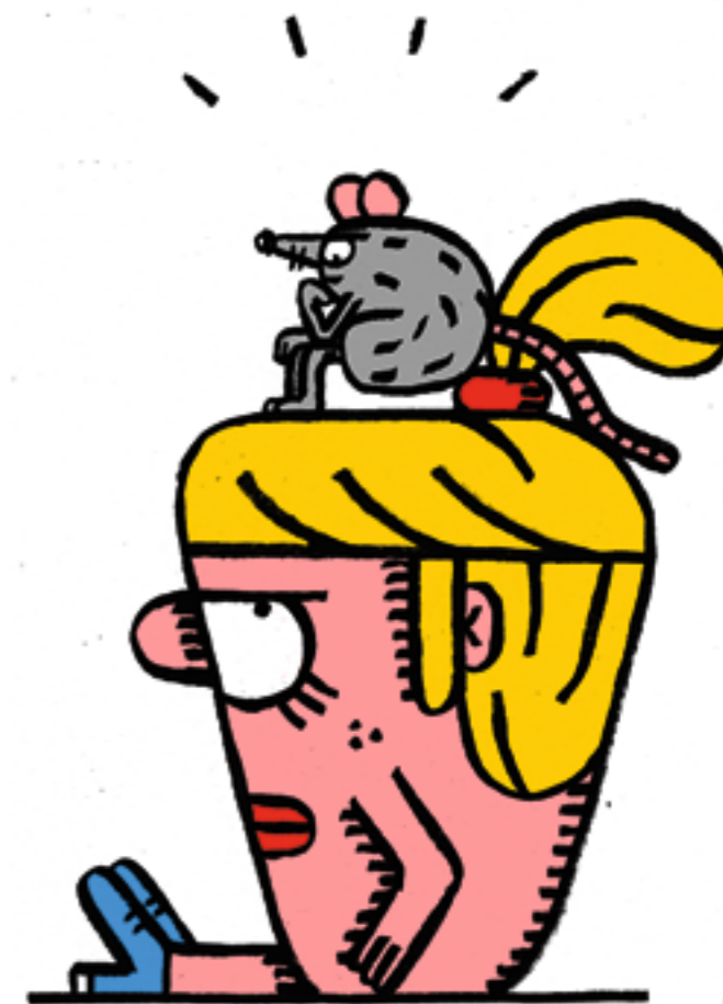
Die Grösse ist nicht das Entscheidende.

Bei den Hochbegabten (IQ höher als 130) dominieren nach wie vor die Männer, und zwar umso mehr, je weiter man die Intelligenzskala emporklettert. Bei IQ 145 beispielsweise beträgt das Männer-Frauen-Verhältnis acht zu eins. Unter den 66 Mitgliedern der Tetra High IQ Society (Aufnahmebedingung: IQ höher als 160) gibt es nur eine einzige Frau. Doch die Männer sollten deswegen nicht frohlocken: Erstens ist der Vorsprung auf die Frauen auch bei den Hochbegabten stark geschrumpft. Zwei-